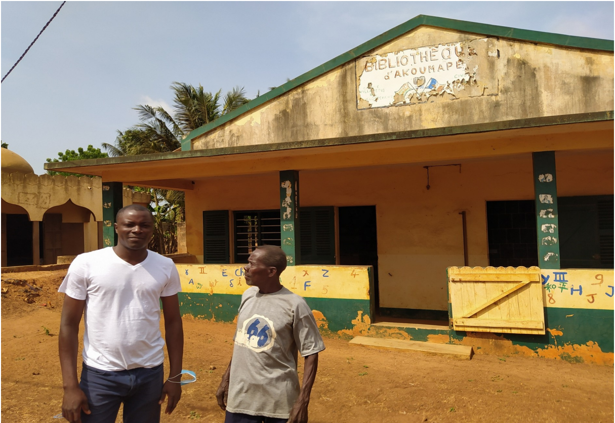
Voici la nouvelle version après la rénovation d'août 2023