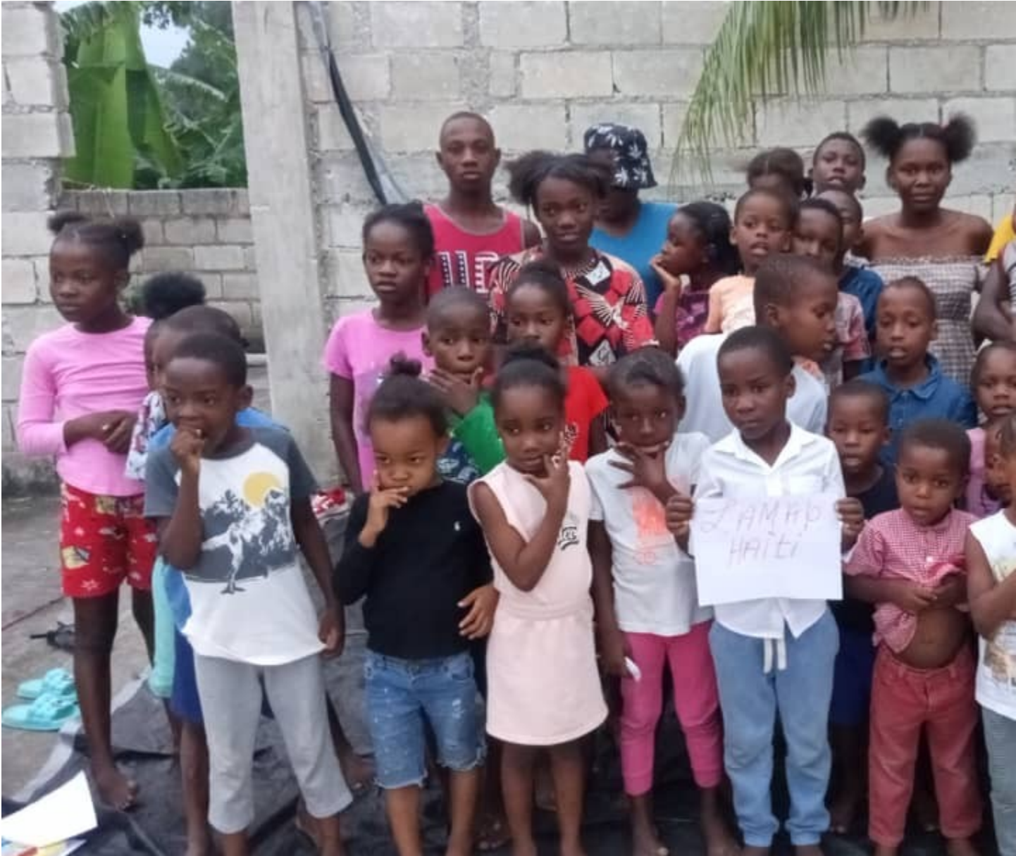
Photo des enfants- Groupe 1, Grand Goave, Haiti.