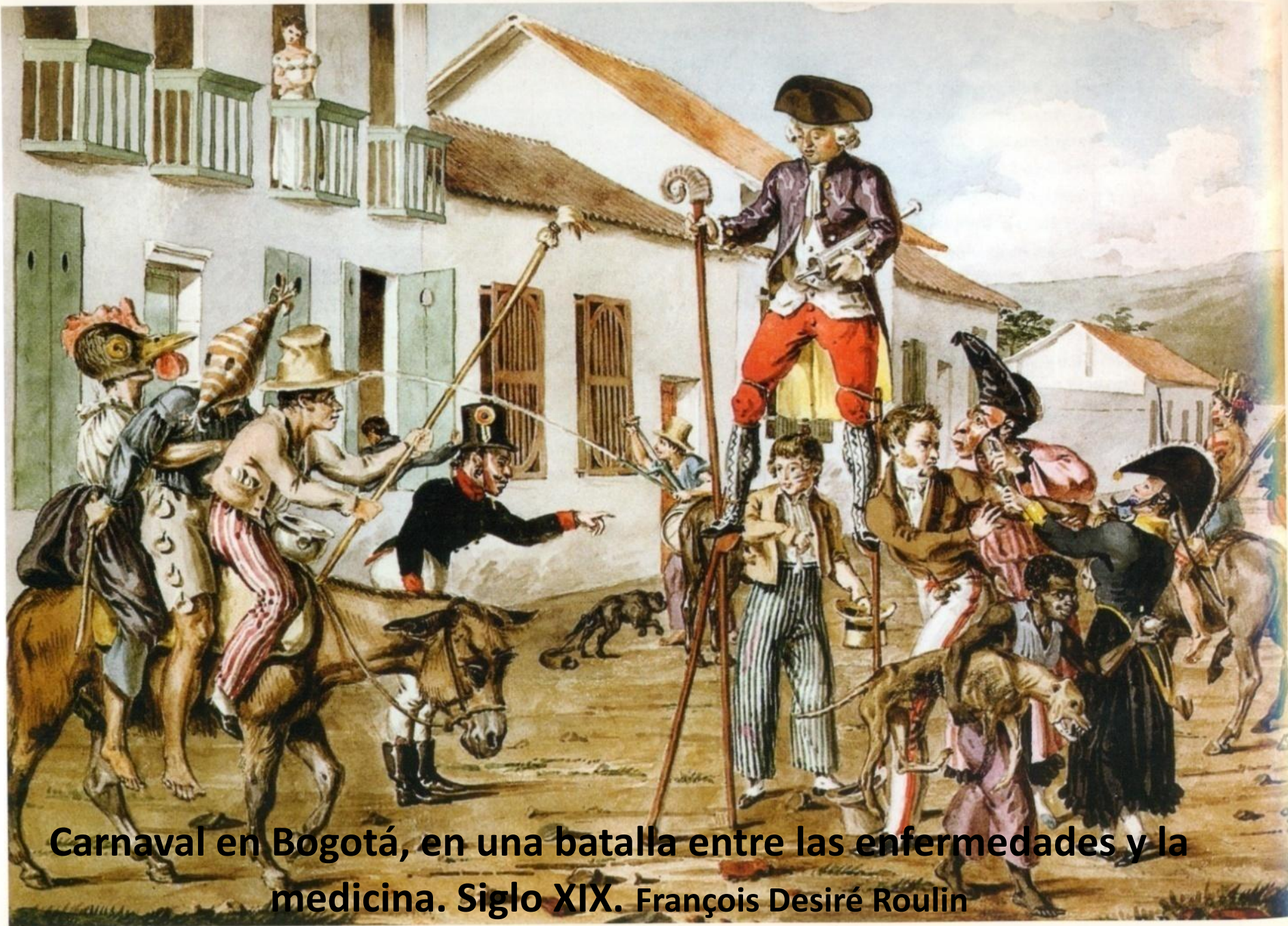
Carnaval en Bogotá, en una batalla entre las enfermedades y la medicina. Siglo XIX. François Desiré Roulin